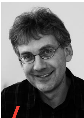
Andreas Balthasar Interface – Institut für Politikstudien, Luzern

Im Auftrag des Parlaments entschied sich der Bundesrat 2005 für die Durchführung eines Pilotversuchs Assistenzbudget der Fachstelle Assistenz Schweiz (FAssiS) in drei Pilotkantonen (Basel-Stadt, St.Gallen und Wallis). Der Pilotversuch dauert vom 1. Januar 2006 bis 31. Dezember 2008. Interface Politikstudien hat im Auftrag des Bundesamts für Sozialversicherungen (BSV) eine Zwischensynthese verfasst, welche auf der Basis mehrerer Teilstudien die bisherigen Erfahrungen mit dem Pilotversuch zusammenfassend dokumentiert.