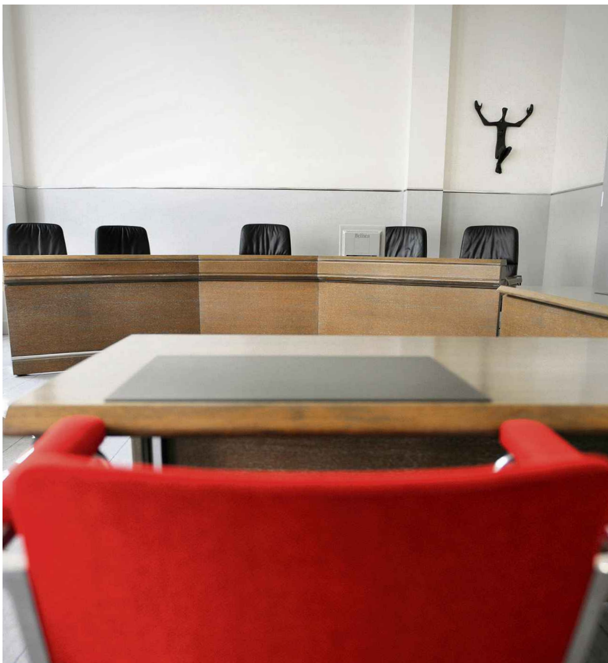
Urteile, die hier gefällt werden, geniessen im Volk weniger Rückhalt als in anderen Kantonen: Verhandlungssaal im Obwaldner Gerichtsgebäude in Sarnen.