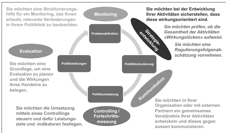
Abbildung 5: Verschiedene Nutzungsarten von Wirkungsmodellen im Politikzyklus